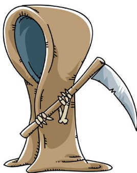
Hello. My name is Leverage. Now die!

اکثر معامله‌گران حرفه‌ای و مدیران سرمایه یک لات استاندارد را برای هر 50,000 دلار در حساب خود معامله می‌کنند. اگر حساب مینی را معامله کنند، این بدان معنی است که یک لات مینی را برای هر 5,000 دلار در حساب خود معامله می‌کنند.