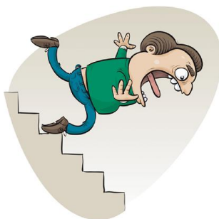
ZOMG!!! I should have opened a demo account!

سیستم معاملاتی خود را برای شکست تنظیم نکنید